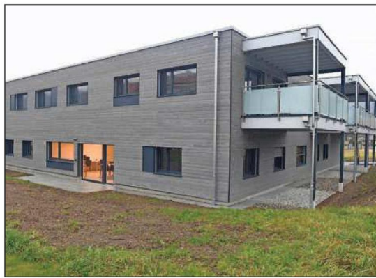
Les trois sites de la Ligue pulmonaire jurassienne sont réunis depuis peu dans un bâtiment flamboyant neuf à Glovelier.

Autre motif de réjouissances pour Ariane Hanser: ce bâtiment a été réalisé inté-